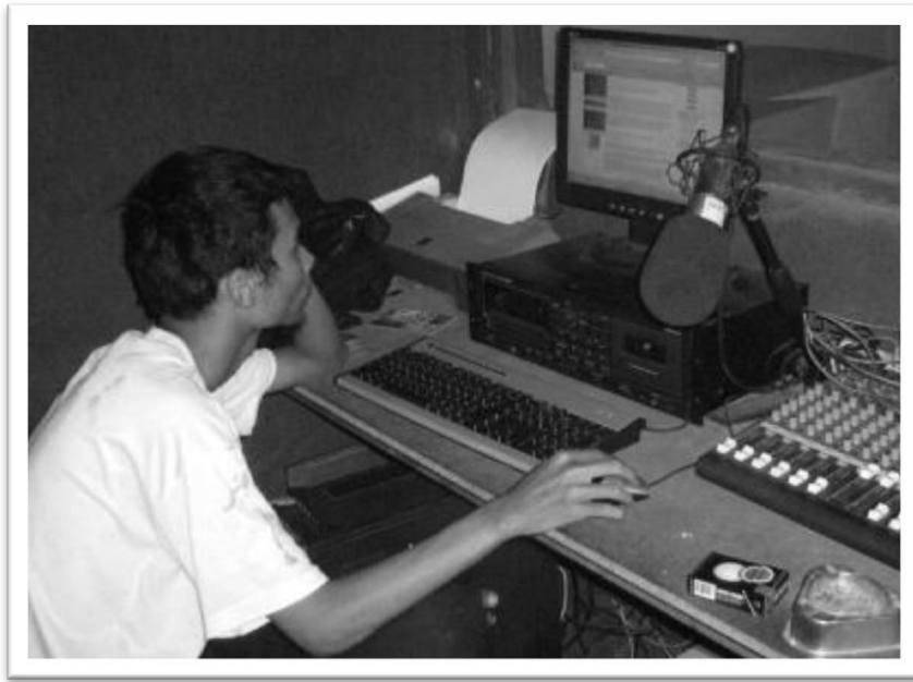
ผู้ควบคุมรายการของ Kusir Angkringan กำลังมอนิเตอร์อินเทอร์เน็ตระหว่างการคุมการออกอากาศสถานวิทยุ

งานหลักที่สถานีวิทยุแห่งนี้ประสบความสำเร็จจนเป็นที่รู้จักคือการตรวจสอบการบริหารงานของ อบต. ของเขา โดยเริ่มจากการถ่ายทอดสดการประชุมพิจารณางบประมาณ ที่นี้ผู้บริหาร อบต.ก็เดือดร้อน เพราะชาวบ้านในพื้นที่นั้นฟังกันหมด ก็ปรากฏว่าผู้ใหญ่บ้านคนเก่าปิดงบประมาณประจำปีไม่ได้ และเสนอ ญัตติงบประมาณของปีถัดมาไม่ผ่าน แล้วผู้ใหญ่บ้านคนนั้นก็รู้ว่าต้องมีชาวบ้านฟังการถ่ายทอดสดจำนวนมาก จำเป็นต้องกลับไปจัดทำงบประมาณใหม่ เป็นผลให้ผู้ใหญ่บ้านโกรธมาก เสียหน้า เพราะเสนอญัตติงบประมาณ ไม่ผ่าน นี่คือวิธีการตรวจสอบทางสาธารณะที่มีประสิทธิผล แต่ 'อังกรังน' ก็อธิบายให้ฟังว่า สิ่งที่ทำไม่ใช่เพื่อ การไปฉีกหน้าใคร แต่ว่าเป็นงานที่จะทำให้การบริหารงานท้องถิ่นมีประสิทธิภาพมากขึ้น นั่นคือสิ่งที่เขายืนยัน ในจุดยืนการทำงาน