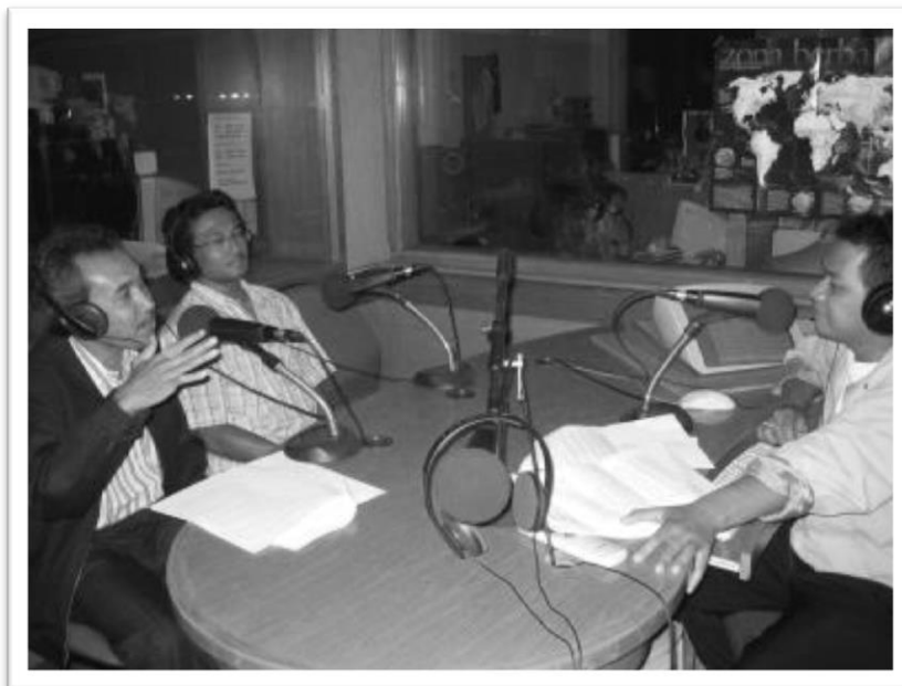
นักจัดรายการวิทยุจาก 68H (ขวา) พูดกับนักวิชาการระหว่างการสนทนาทางวิทยุเมื่อสิงหาคม 2007

ถัดมาจะเป็นลักษณะสื่อทางเลือกขนาดใหญ่ขึ้น ชื่อสถานีจึงเป็นชื่อบ้านเลขที่ “68H Radio” ที่แรกก็ถามว่าทำไมตั้งชื่อนี้ เขาก็บอกว่าไม่รู้จะตั้งชื่ออะไรดีเรียกไม่ถูก เพราะว่าองค์กรสื่อเกิดใหม่ ซึ่งเกิดจากการล้มประธานาธิบดีซูฮาร์โตไปแล้วก็กระตือรือร้นอยากทำงานขับเคลื่อนสังคมหลากหลายอย่าง แล้วก็ไปมีสถานที่อยู่ในอาคารที่กลุ่มนักเคลื่อนไหวด้านสื่อแรกๆ ที่เป็นพวกใต้ดิน เขาจึงตั้งชื่อเป็นบ้านเลขที่ที่ก็แล้วกัน แล้วก็คิดฝันว่าจะเป็นสำนักข่าว ด้วย เหตุที่ประเทศอินโดนีเซียมีเกาะอยู่ประมาณ 2,000 กว่าเกาะ “68H Radio” จึงไปตั้งสถานีลูกข่ายจำนวนมากกว่า 400 สถานีในแต่ละเมือง แต่ละชุมชนชั้นอาสาเข้ามาว่าอยากจะอยู่ในเครือข่าย แล้วก็มีการพิจารณาว่าจะต้องเป็น ”อิสระ“(independent) และก็เป็นที่น่าเชื่อถือ (Trust worthy) เพราะฉะนั้น “68H Radio” ก็ทำขึ้นมา ปีที่ไปทำวิจัยมีจำนวนเครือข่ายประมาณ 2,000 กว่าแห่งแล้ว โดยการเชื่อมเครือข่ายวิทยุนี้มีการใช้เครื่องคอมพิวเตอร์ การตัดต่อเสียงด้วยการใช้คอมพิวเตอร์มีมากขึ้น แล้วก็ปรากฏว่าเขามีนักข่าวกับคนทำงานที่อยู่ในฝ่ายข่าวเป็นผู้หญิงจำนวนมาก โดยเป็นเป้าหมายหนึ่งของเขา เช่นเดียวกัน “68H Radio” คิดว่าความสามารถของผู้หญิงไม่ได้ด้อยไปกว่าผู้ชาย เพราะฉะนั้น เป็นการสร้างวัฒนธรรมที่แตกต่างจากหนังสือพิมพ์กระแสหลักในประเทศอินโดนีเซียอย่างยิ่ง